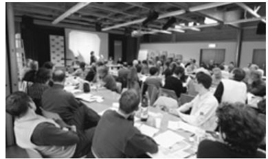
Der Parteitag in Liestal wurde durch das Sekretariat der SP Baselland organisiert.

Die Geschäftsleitung verabschiedete im vergangenen Jahr 21 Vernehmlassungsantworten zu kantonalen Vorlagen. Die SP Baselland äusserte sich im Berichtsjahr unter anderem zum Familienzulagengesetz (Gegenvorschlag zur SP-Initiative «Höhere Kinderzulagen für alle»), zum Hanfgesetz, zum Integrationsgesetz und zur Fachhochschule Nordwestschweiz. Alle Stellungnahmen der SP Baselland finden sich auf unserer Internetseite.