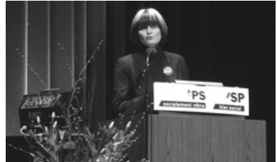
Frauenpower im Bundesrat: Micheline Calmy-Rey.

Im Rahmen der Aktion «Frauenwache» in Bern, die im Zusammenhang mit der Bundesratswahl vom 10. Dezember 2003 gestartet worden ist, übernahmen die SP-Frauen Baselland am 17. Oktober 2004 eine Schicht. Die Wache wurde über 24 Stunden gehalten und auch von den SP-Frauen Basel-Stadt unterstützt.