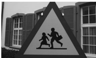
Die JUSO Baselland engagieren sich auch für die Initiative «Keine Schulgebühren».

Auch eine Jungpartei braucht Grundsätze, um sich zu positionieren. Deshalb entstand ein Grundsatzpapier, in dem wir unsere Schwerpunkte zu Bildung, Arbeitswelt, Umwelt, Gesundheit, Wohnraum, grenzüberschreitender Zusammenarbeit sowie Finanzen und Steuern festlegten.