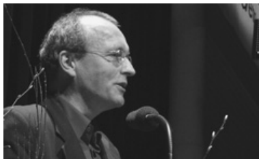
Hans-Jürg Fehr, Präsident der SP Schweiz.

Eine Selbstverständlichkeit, sollte man meinen. Doch bei der Budgetdebatte hat sich gezeigt, dass die bürgerlichen Fraktionen im blinden Schulterschluss der Sparhysterie so stark verfallen sind, dass sie den Regierungsrat sogar noch übertrumpfen wollten. Diese Haltung lag ganz auf der Linie der im April gegen unseren Widerstand überwiesenen Motionen für eine Personalreduktion in der Verwaltung. So erfreulich die gute Resonanz unserer klaren Positionierung nach aussen ist, so unbefriedigend bleibt es, dass im Rat selber damit vorerst kaum etwas zu gewinnen ist. Immerhin konnte erreicht werden, dass eine vorgesehene massive Beschränkung der parlamentarischen Debatte, die die Budgetdiskussion zur Alibiübung degradiert hätte, nicht durchgekommen ist.