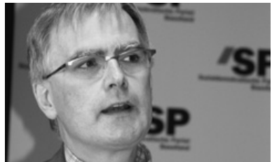
Regierungsrat Hans-Peter Uster aus Zug erläutert Möglichkeiten einer linken Sicherheitspolitik.

Neben dieser grundsätzlichen thematischen Positionierung erarbeitete die SP-Landratsfraktion im Berichtsjahr zwei Positionspapiere zur aktuellen kantonalen Gesundheits- und zur Finanzpolitik. Beide Papiere waren per Jahresende noch in Bearbeitung.