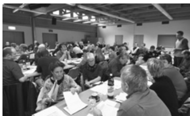
Die SP Baselland positioniert sich zur Sicherheitspolitik.