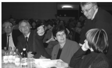
Prominenz am Parteitag der SP Schweiz in Basel.

Unsere Gruppe führte wie gewohnt zehn Veranstaltungen durch, die meist gut besucht waren. Zudem besuchten wir mit den JUSO eine Ausstellung im Barfüsser-Museum.