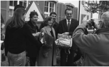
Einreichung der Initiative «Keine Schulgebühren».

Die Geschäftsleitung zielt darauf, auch mit thematischen Kampagnen, die nicht in einem direkten Zusammenhang mit einer Abstimmungsvorlage stehen, die öffentliche Meinung zu beeinflussen. Dieses Ziel konnten wir aber leider auch im vergangenen