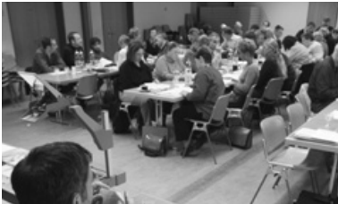
Engagierte Diskussion zur Sicherheitspolitik am Parteitag vom 6. November 2004.

Die politische Arbeit im Landrat stand das ganze Jahr immer irgendwie im Schatten der Generellen Aufgabenprüfung (GAP), die schon 2003 angekündigt aber noch nicht fassbar geworden war. Trotz der offiziellen Präsentation im Mai, trotz der im September zur Vernehmlassung unterbreiteten Vorlage, ist dieses