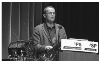
Nationalrat Werner Marti am Parteitag der SP Schweiz in Basel, März 2004.

Das Jahresziel für 2005 ist erneut die Durchführung von drei clubartigen Treffen. Daneben soll das SP-Netzwerk KMU Nordwestschweiz auch noch besser regional verankert werden. Bislang war fast ausschliesslich die SP Baselland federführend.