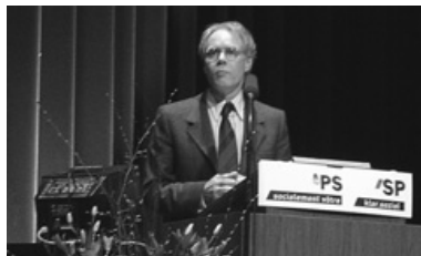
Moritz Leuenberger spricht am Parteitag der SP Schweiz zu den GenossInnen.